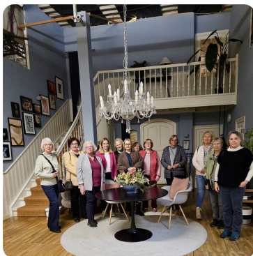
Frauen Union Lüneburg goes Roten Rosen