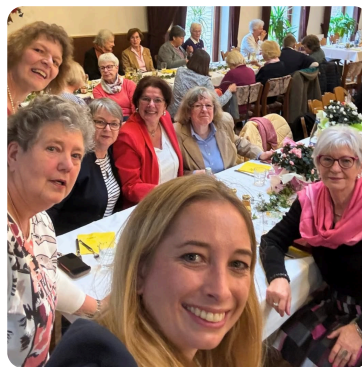
75 Jahre Landfrauen