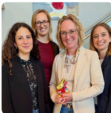
Frauen MIT Fokus