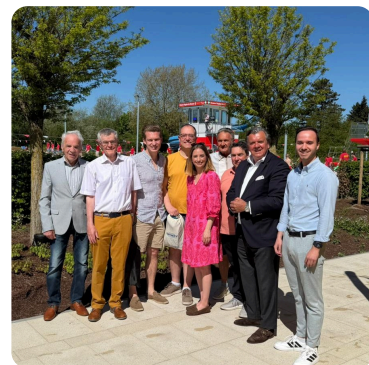
Eröffnung des Freibades

Drei Termine, drei ganz unterschiedliche Einblicke in unsere Region: Beim Quadrat Abend auf dem webnetz Campus wurde deutlich, wie lebendig Wirtschaft, Kreativität und Vernetzung in Lüneburg sind.