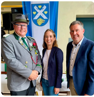
Schützenfest in Wendisch Evern